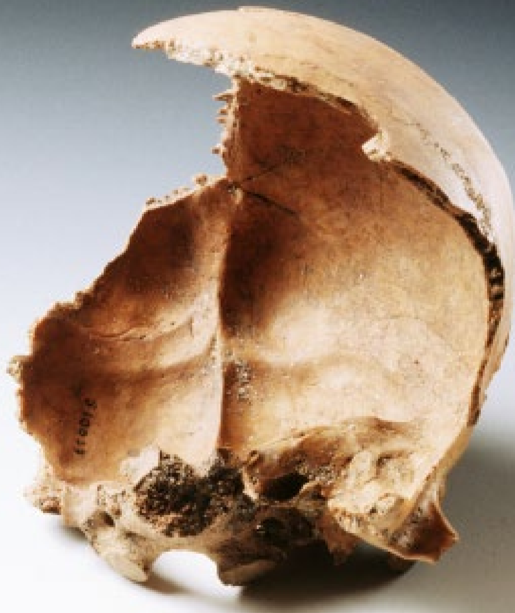
Hodeskallen til et menneske. Han druknet ved Karmøy en gang i vikingetiden.

Arkeologisk museum, Universitetet i Stavanger