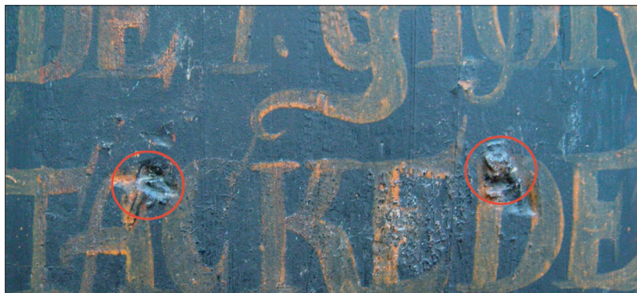
Spor etter eldre treplugger og festepunkter