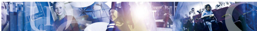
Det samfunnsvitenskapelige fakultet