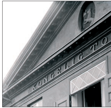
Detalj av foto fra 1897

Se innslaget "Tollbod tilbake til 1840" på NRK Rogaland 10. mars hvor funn av riksvåpen og tysk påskrift blir omtalt: http://www1.nrk.no/nett-tv/klipp/472556